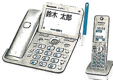
電話機 VE-GD76DL/DW パナソニック (株)