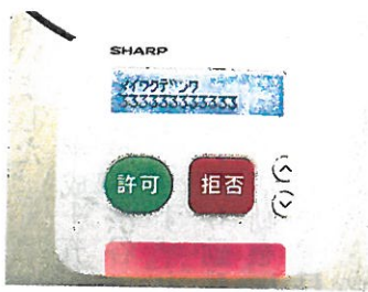
迷惑電話フィルタボックス JD-AH1 トピラシステムズ (株) (シャープ (株))