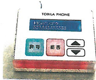
迷惑電話対策装置 トピラフォン トピラシステムズ (株)