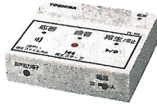
防犯用電話自動応答録音アダプター TY-REC1(W) 東芝エリートレーディング (株)