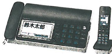
ファクス KX-PD615DL/DW パナソニック (株)