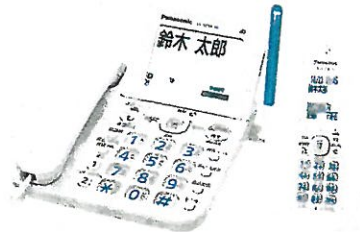
電話機 VE-GD66DL/DW パナソニック (株)