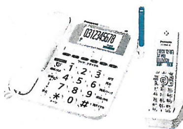
電話機 VE-GE10DL/DW パナソニック (株)