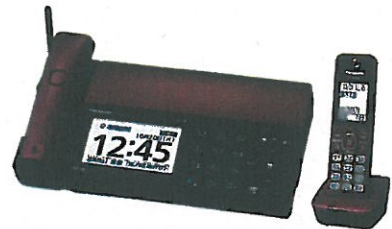
ファクス KX-PD102D/DL パナソニック (株)