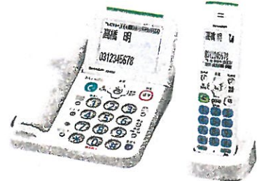
電話機 JD-AT85 シリーズ シャープ (株)