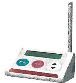
迷惑電話チェッカー WX07A ソフトバンク (株)