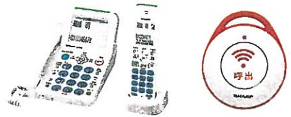
電話機 JD-AT82 シリーズ シャープ (株)