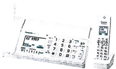
ファクス KX-PD205DL/DW パナソニック (株)