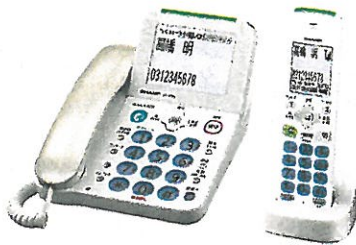
電話機 JD-AT81 シリーズ シャープ (株)