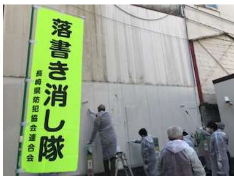
落書き消し活動（長崎市）