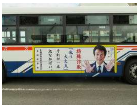
特殊詐欺被害防止広報啓発活動