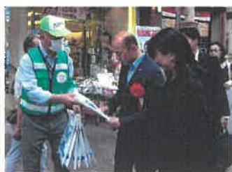
【広報状況（長崎市長への広報）】

同キャンペーンは、歯科医師会の「良い歯」キャンペーンに合わせて実施し、さらに県警音楽隊の派遣演奏もあり、キャンペーンを盛り上げた。