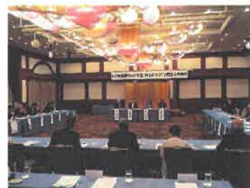
【安全・安心県民会議】

6月5日（水）、長崎市元船町サンプリエールにおいて開催された会議に出席し、令和5年度の活動報告及び令和6年度の活動計画を決議。