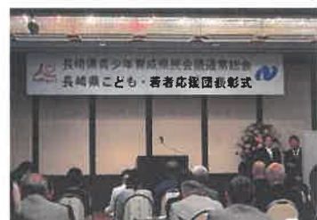
【青少年育成県民会議】

6月7日（金）、長崎市筑後町ホテルセントヒル長崎において開催された会議に出席し、令和5年度の活動報告及び令和6年度の活動計画を決議。