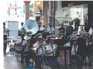
【音楽隊の演奏状況】